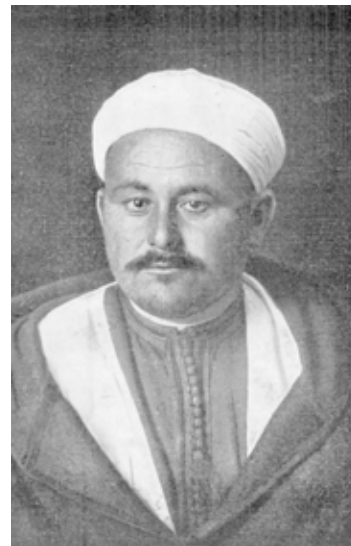
En el Rif, España encontró un formidable enemigo en Abd el Krim el Jatabi cuya rebelión contra España produjo el llamado Desastre de Annual. ("Alhucemas" de A. Muñoz Bosque)

"De Igueriben a Perejil y 75 laureados", no solo estudia con detalle la marcha de los acontecimientos en las dos regiones citadas, sino que, en el caso del Rif, se hace una