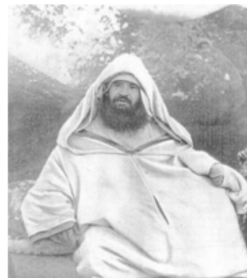
El Raisuni fue el gran enemigo de España en la zona de Yebala hasta que, tras un ataque rifeño, cayó en manos de Abd el Krim, con quien se había negado a colaborar. Murió en el cautiverio