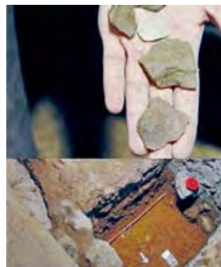
CEDIDAS Hasta ahora, la excavación comprende un m2. Restos hallados.

El sondeo practicado frente a estos restos del siglo X ha permitido excavar por primera vez niveles prehistóricos que,