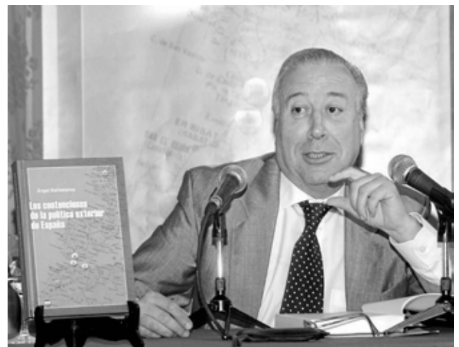
El Instituto de Estudios Ceutíes publicó "Estudio diplomático sobre Ceuta y Melilla" y "Los contenciosos de la política exterior de España" en su versión española e inglesa, ambos del Embajador Ballesteros

La explicación parece simple y sobrepasa el marco jurídico para inscribirse abiertamente en el ámbito parapolítico, ya que en los tres