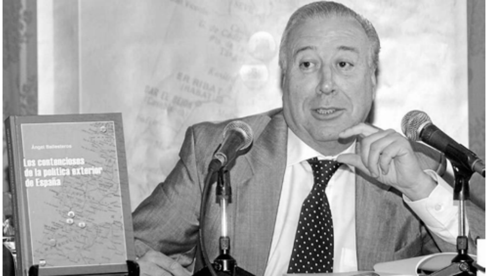
El embajador y diplomático Ángel Manuel Ballesteros, en Ceuta durante la presentación de uno de sus últimos libros.

—Décadas después del fin del Protectorado y de que Marruecos se constituyera como Estado, Rabat sigue reclamando, como el primer día, la soberanía sobre las que considera “plazas ocupadas de Ceuta y Melilla”. ¿Es una aspiración real o un mero mensaje de ‘consumo interno’ que reproduce cuando le interesa? —Forma parte perenne del ideario y de la política rabatí, que Palacio utiliza adecuada y coyunturalmente. Yo calificué a Hassan II en sus funerales como “el gran dosificador de las relaciones con España”, que posiblemente sea el término con mayor carga en las relaciones bilaterales. Hizo el honor de recibirme varias veces y llegó a decirme “es usted el segundo español con el que hablo de estos temas”. El primero fue Don Juan, con quien también coincidí. Él utilizó oportunamente la técnica de la coyuntura, mientras que Mohamed VI, a quien acompañé en los funerales de Franco y en la coronación de Juan Carlos I, en la misma acertada línea para los intereses marroquíes, ha bajado el tono hasta donde la coyuntura lo permite, que en la actualidad, con las relaciones en niveles próximos a excelentes, es bastante.