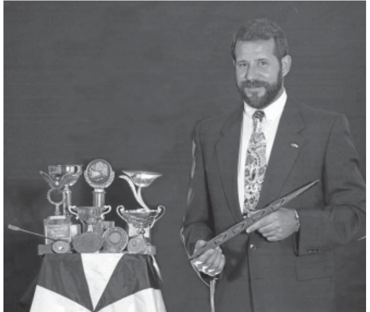
En los Juegos Olímpicos de Montreal llegó a conseguir la medalla de plata en K-4 y el oro en el campeonato mundial de Belgrado.