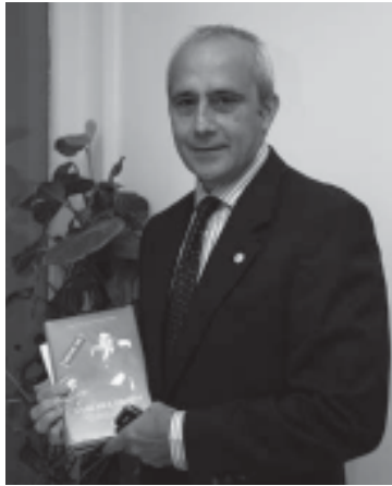
CEDIDA Francisco Sánchez Montoya, autor del libro.

inmediatez de la muy familiar calle "Larga" (la Rua Direita de la colonización portuguesa). La última casa que habitó nuestro personaje, frente a la iglesia de los Remedios (calle Soberanía Nacional, hoy calle Real), creo haberla visto en pie en mi infancia, y no tanto, con su galería acristalada exterior, a un tiro de piedra del paraíso de los juguetes