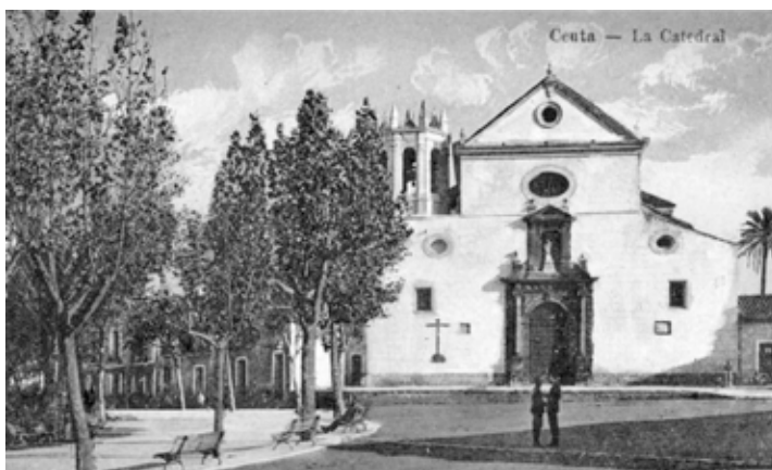
CATEDRAL DE CEUTA ANTES DE SU REMODELACIÓN A MEDIADOS DEL S. XX.

Los cristianos locales debieron transitar los caminos de la fe de aquellos primeros tiempos, con sus aciertos y sus errores, con bizantinos, visigodos y vándalos, hasta que con la llegada de las tropas musulmanas en el 709 se convirtieron, de nuevo, en minoría tolerada, en comunidad mozárabe. Debíó ser