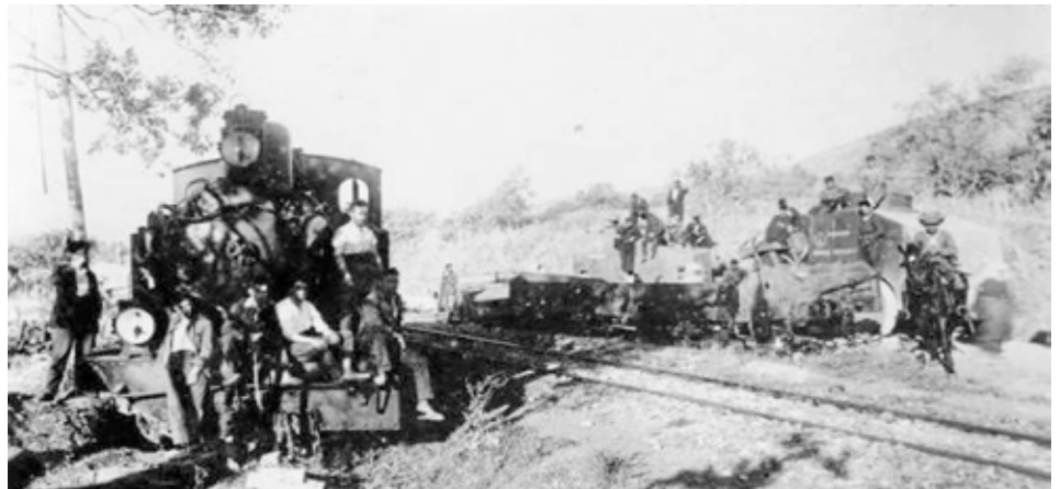
12. En 1924 se produjo el primer grave descarrilamiento del ferrocarril.

En 1924 se produjo el primer grave descarrilamiento del ferrocarril. Casi dos décadas después, el 28 de marzo de 1940, explotó la caldera de una locomotora a la altura del cruce de la Base Aérea de Tetuán, provocando la muerte instantánea del maquinista y del fogonero, cuyos cuerpos quedaron completamente destrozados. Ambos fueron velados en la estación ceutí, celebrándose sus funerales en la Santa Iglesia Catedral, recibiendo sepultura en el cementerio de Santa Catalina. En 1955, un fuerte temporal arrasó los puentes de la carretera y el del ferrocarril, dejando la vía en el aire. Afortunadamente los automotores habían pasado pocas ho-