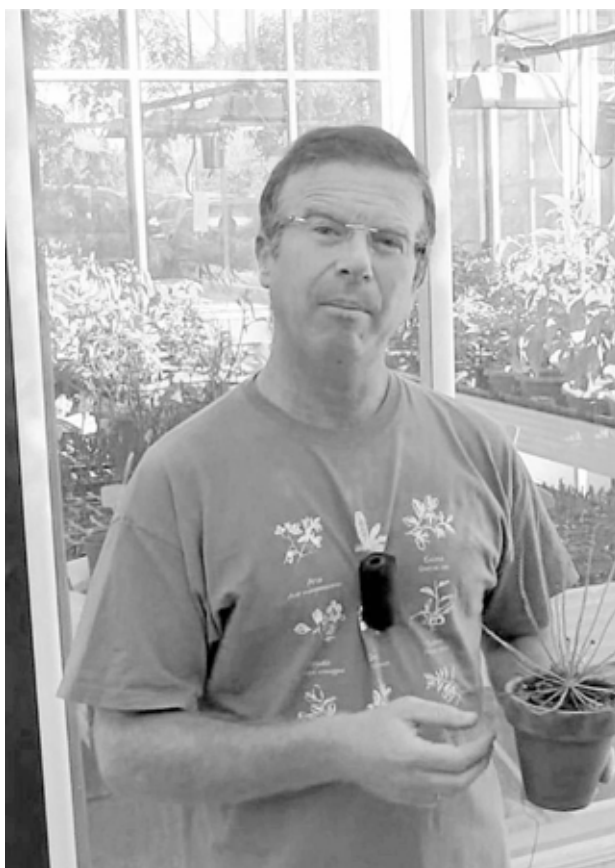
Ojeda será el primero en intervenir, lo hará a las 18:15 horas en la Sala de Usos Múltiples de la Biblioteca Pública.

–La realidad de las plantas carnívoras no es tan fascinante como creemos de antemano, sin embargo, su forma de atrapar sí que lo es. Atrapa a sus presas con el mucílago pegajoso de las glándulas de sus hojas. Atrapa a los insectos a sus hojas-trampa a