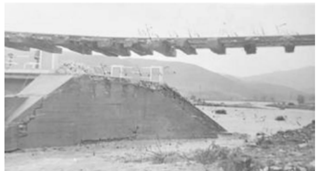
En 1955, un fuerte temporal arrasó los puentes de la carretera y el del ferrocarril, dejando la vía en el aire. Afortunadamente los automotores habían pasado pocas horas antes. Reproducción

ras antes. Reproducción. El 20 de noviembre de 1955, las torrenciales lluvias y un terrible temporal de levante desbordó el río Castillejos, arrasando toda su vega y llevándose por delante los dos puentes que lo atravesaban, el de la carretera y el del ferrocarril, cuyas vías quedaron suspendidas en el aire. Siete personas perecieron al precipitarse los automóviles en los que viajaban al torrente de agua que bajaba, arrastrándolos seguidamente mar adentro.