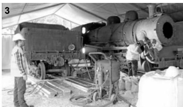
1.-La restauración de Diego Vivo al frente de una escuela taller del INEM se quedó sólo en esta pieza. 2.-Interior del hangar donde estuvo la C-1 hasta 1995 entre todo tipo de objetos abandonados. 3.-Reciente proceso de restauración de la máquina.