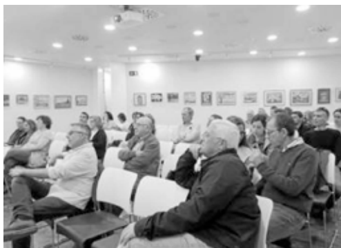
La segunda jornada volvió a contar con una gran asistencia.