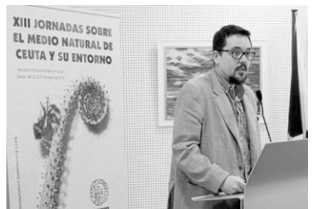
El IEC encargó hace un año a Blanco que investigase las diatomeas de Ceuta.

Hemos descubierto novedades florísticas tanto para la zona de África como para la europea”. En Ceuta han conseguido catalogar cinco nuevas especies, sin embargo, “la pregunta del millón” llega con la cuestión de su endemismo.