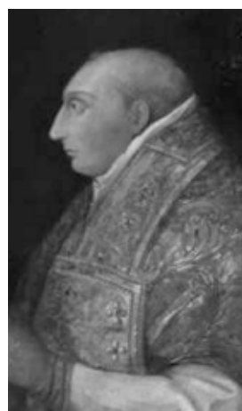
MARTÍN V. PISANELLO

una Iglesia numerosa, que en tiempos de los bizantinos tuvo otro templo que las fuentes medievales islámicas dicen que ocupó el solar de la Mez- quita Aljama, y pudo ser sede episcopal, según recogen numerosos historiadores.