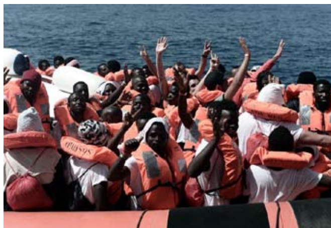
Pedro Sánchez se vio obligado a recular en su postura inicial sobre la inmigración en Europa ante el riesgo de que “se le volviera en contra”.

un pacto con Angela Merkel en la misma dirección, que se sumó a las tesis de Francia y España sobre una “responsabilidad solidaria”, de todos los países de la Unión, con respecto al problema de la inmigración.