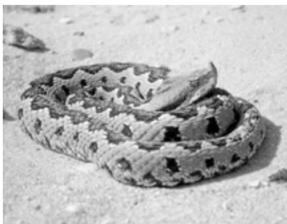
La víbora hocicuda es autóctona del norte de África.

se ha localizado ningún ejemplar en los últimos 50 años. La erradicación de uno solo de estos núcleos supondrá “la desaparición de un linaje evolutivo muy antiguo, con lo que se perdería una gran diversidad genética y una importante historia evolutiva del grupo”.