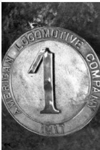
Tapadera del cofre de la locomotora 'Ceuta', retirado y restaurado en 1994

Ante la imposibilidad de adquirirla en Europa por la primera gran guerra, nuestra