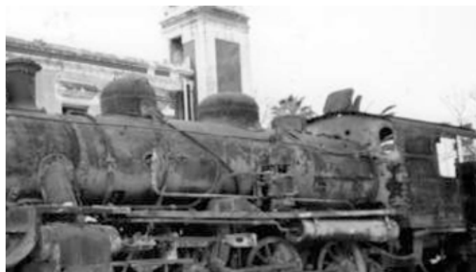
Talleres de la estación ceuti. En su hangar del fondo, a la izquierda, puede observarse a la locomotora 'Ceuta (Reproducción). Derribado su emplazamiento, la locomotora 'Ceuta' permaneció abandonada a la intemperie y a merced del vandalismo durante unos tres lustros.