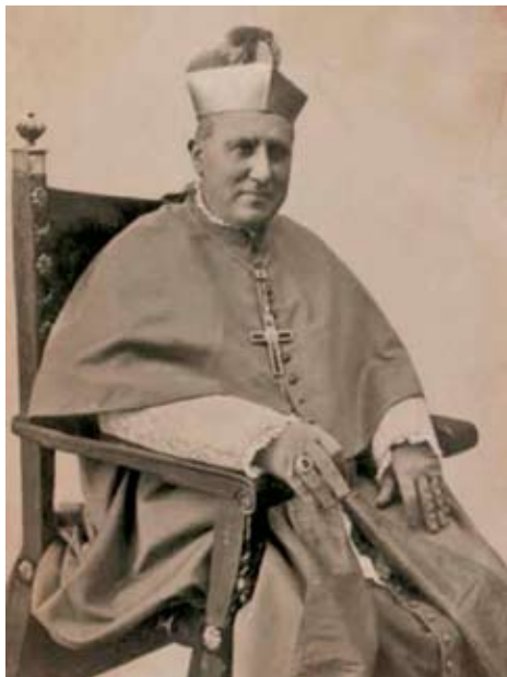
RAMÓN PÉREZ RODRÍGUEZ, PATRIARCA DE LAS INDIAS